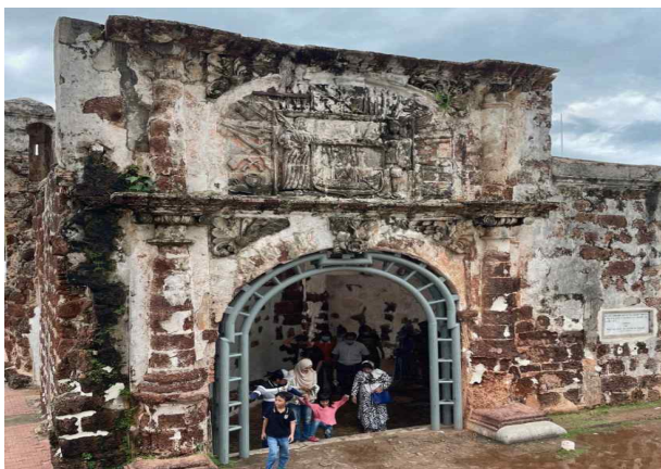
(산티아고 요새) 1511년 포르투갈이 말라카를 점령하면서 원주민을 동원하여 만든 요새