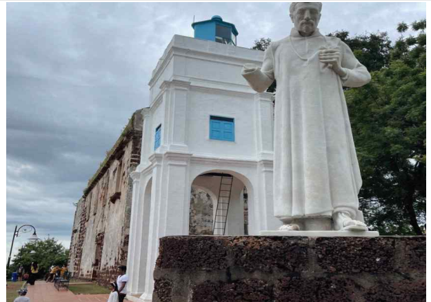
(세인트폴 교회, 1521년 완공) 기도원으로 사용, 포르투갈의 그리스도 포교의 핵심 거점지