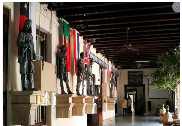
(스타더이스) 네덜란드 총독의 공관으로 쓰이던 곳, 역사박물관, 말라카 대표 건물