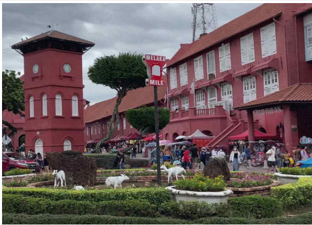
(네덜란드 광장) 말라카의 중심에 위치, 원형광장, 그리스도 교회 등 다양한 볼거리를