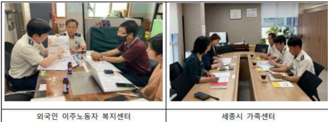
외국인 이주노동자 복지센터