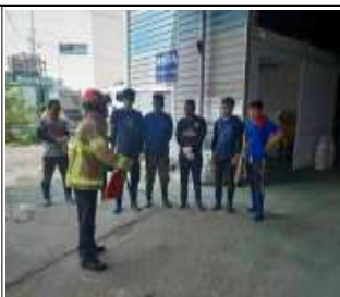
소방안전교육 및 안전지도