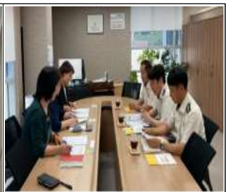
외국인 이용시설 협의체 구성

○ 외국인 이용시설(2개소) 지속 협업을 통한 외국인 가구 주택용 소방 시설 설치·지원 및 교육·홍보 활동 협조(연중)