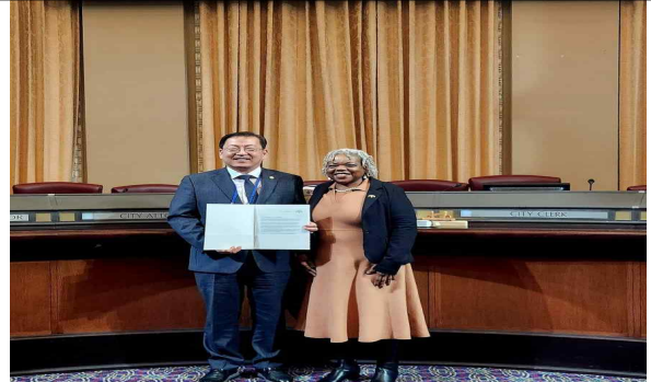
< 기념촬영(의회 대회의실) >