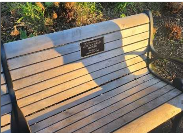
< 의자 기부 >