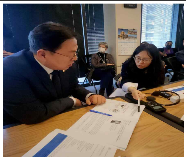
< 기관 소개 및 질의·답변 >