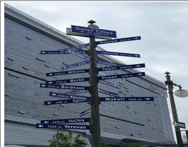
< LA 자매결연 도시 >