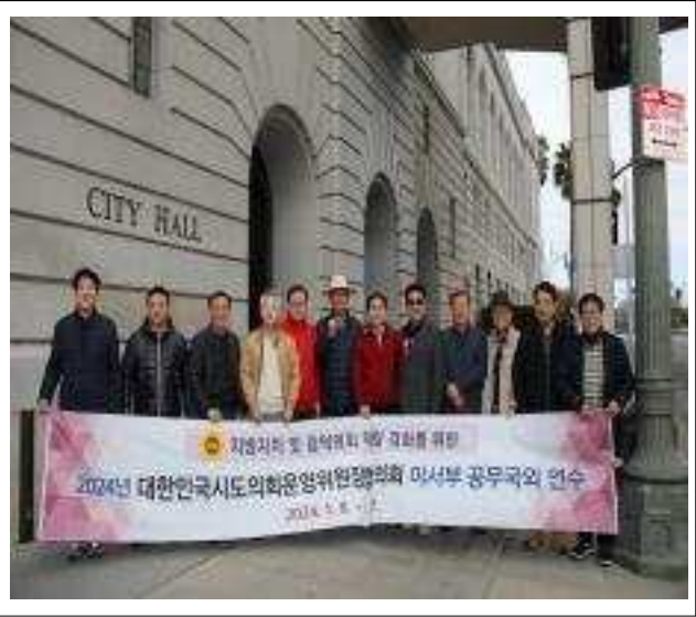
< 기념촬영(LA시청) >