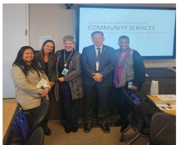
< 기념품 증정 및 기념 촬영 >