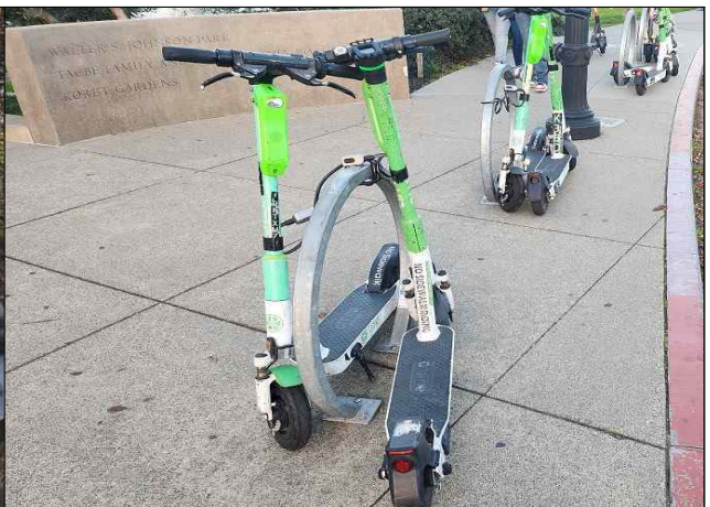
< 원형 PM 거치대 >