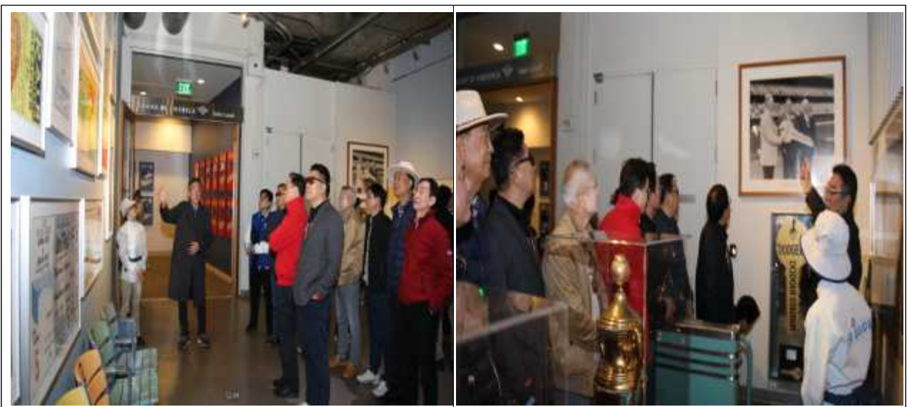
< LA다저스 역사의 공간 >