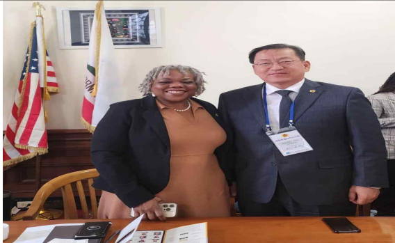
< 기념촬영(오클랜드시의회) >