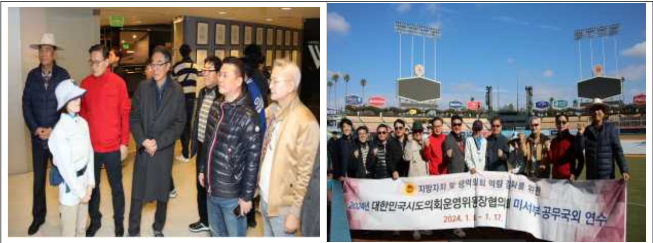
< LA다저스 경기장 >