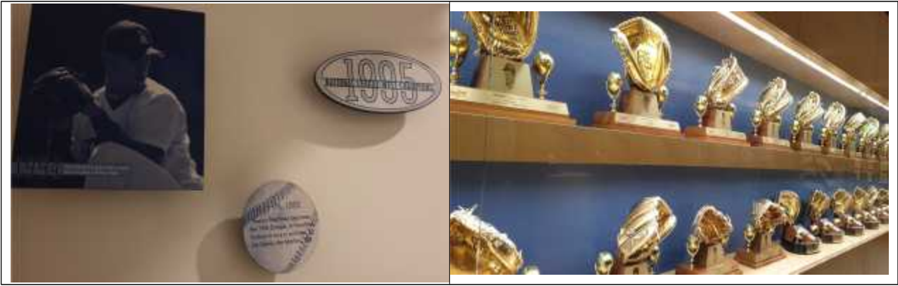
< LA다저스 역사의 공간 >