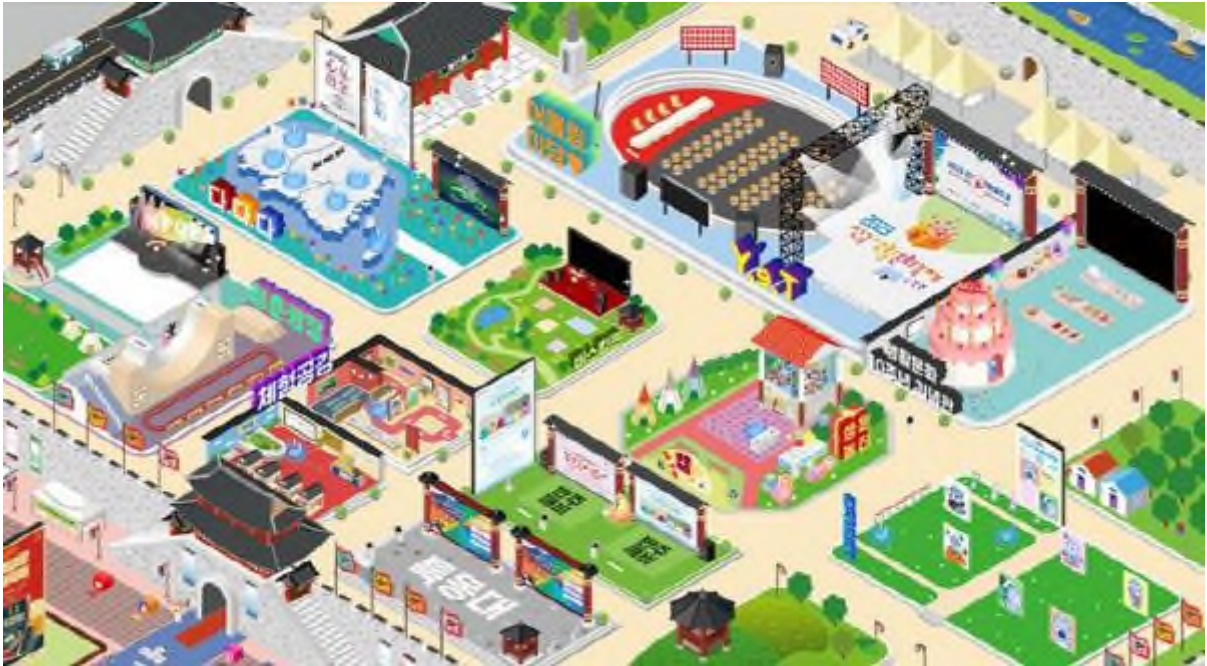
2023전국생활문화축제 메타버스 플랫폼 이미지.

경남 진주문화관광재단은 ‘2023전국생활문화축제’ 온·오프라인 이원화를 통한 축제장 현장과 온라인 축제장을 연계하는 시·공간적 제한이 없는 축제의 실현을 위해 메타버스 플랫폼을 오픈했다고 21일 밝혔다.