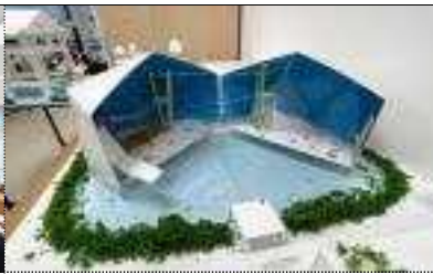
여름건축학교 작품 제작