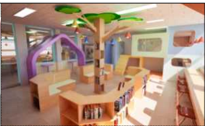
세종꿈마루(통합) 사용자참여설계 디자인(연봉초)