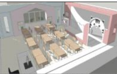
세종꿈마루(교실) 사용자참여설계 디자인(늘봄초)