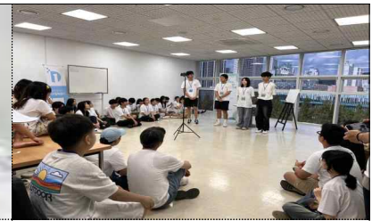
여름건축학교 작품 발표