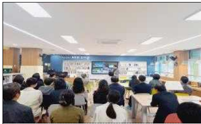
대전 장동초 공간탐방

※ (날짜) 2024. 7. 19.(금)~7. 21.(일), (장소) 보람동 복합커뮤니티센터, (참여 인원) 중고등학생 30명, (내용) 학생 아이디어를 바탕으로 대학생, 건축사 튜터와 작품 제작 및 발표