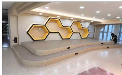
세종꿈마루(영역) 실행학교 공간조성(아름초)