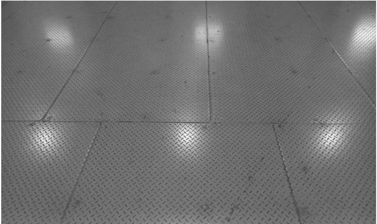
바닥 철판 이어붙이기 상태